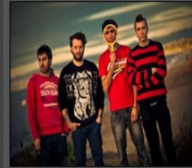
Vanz - Endless Summer - C

TOP SONG: "Through Your Eyes" Recensione by L. Di Michele (Nick Name --- sIRsILENCE---